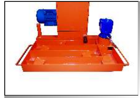
Ubicación del decantador