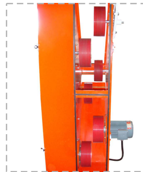
Poleas revestidas con poliuretano