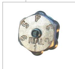
Roseta "RIAL" para compas cortacírculos. Código: 442.02.