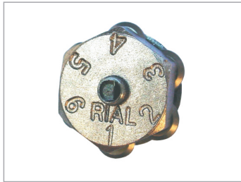
Roseta "RIAL" 6 rulinas acero al carbono Código: 442.02