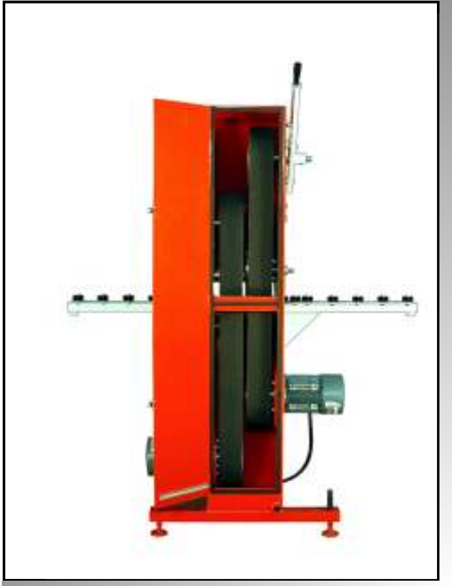
Poleas revestidas con poliuretano